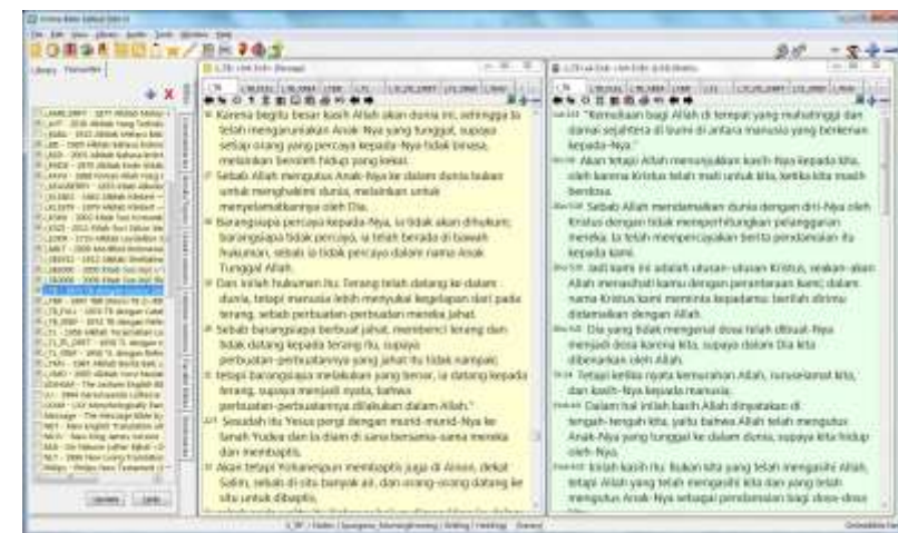
Software SABDA (Bhs Indonesia non drama)