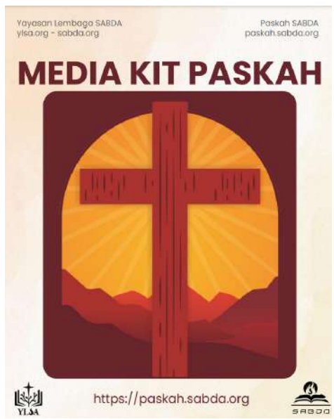
Media Kit Paskah