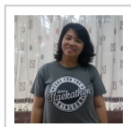
Redaksi Tamu IT-4-GOD, Davida